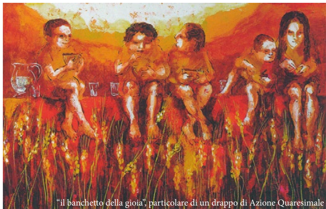
"il banchetto della gioia", particolare di un drappo di Azione Quaresimale

Un invito inatteso che dimostra che esistono persone con la mente talmente leggera da non temere lo sconosciuto, con un animo generoso, pronte a condividere il poco che hanno, con un cuore grande da accogliere lo straniero alla propria tavola. L'anziano signore napoletano aveva capito che la gioia che può dare la tavola non dipende da ciò che ci sta sopra, ma da chi si siede attorno, poiché sapeva cucinare, ma soprattutto vivere, con leggerezza, generosità, amore.