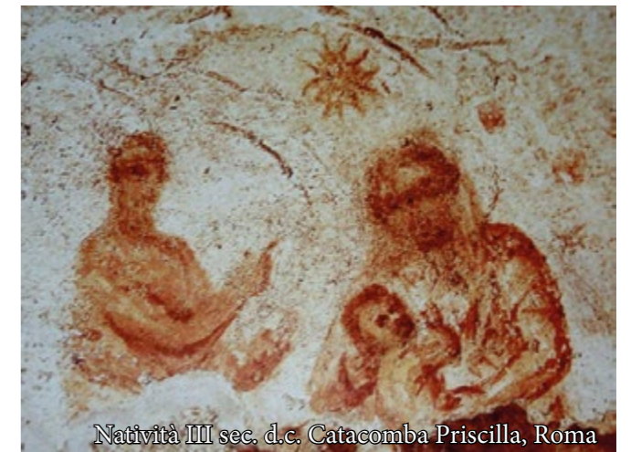
Natività III sec. d.c. Catacomba Priscilla, Roma

in una gioia nuova e più profonda di quella che pensiamo di ricavare da ciò su cui possiamo mettere le mani. "Venite, fedeli, lieti accorrete! La luce divina risplende su noi". Il Natale di Gesù non è un evento che diventa gioioso, se le condizioni esterne lo permettono, se il mondo è finalmente in pace e la nostra allegria non viene più disturbata dal pensiero che ci sono sulla terra uomini e donne meno fortunati di noi. È l'irruzione dell'Inconcepibile che la Vergine ha concepito, nel suo cuore prima che nel suo grembo. È il dono dello Spirito di Cristo, che dall'intimo di ciascuno di noi rimette oggi in cammino la nostra umanità, sollevandola dall'angoscia di doversi giustificare ai propri occhi. Siamo amati di amore eterno e incondizionato, resi pellegrini e generati dalla Speranza, così bella e smisurata da non poter essere che vera! Solleviamo lo sguardo, allora, e... pedaliamo!