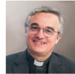
mons. Valerio Lazzeri Vescovo emerito della diocesi di Lugano

Bollettino della Conferenza Missionaria della Svizzera italiana e di Missio inviato ai benefattori in abbonamento vincolato alle offerte.