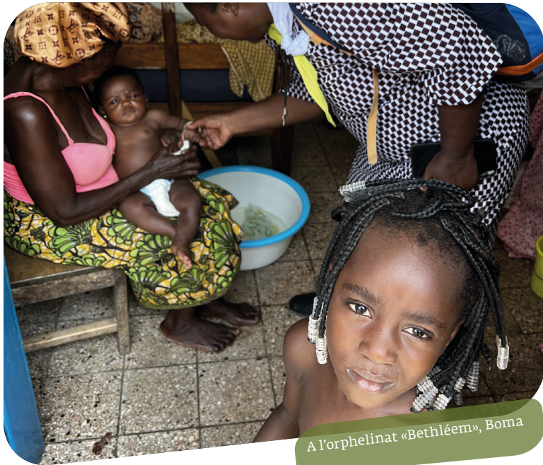
A l'orphelinat «Bethléem», Boma