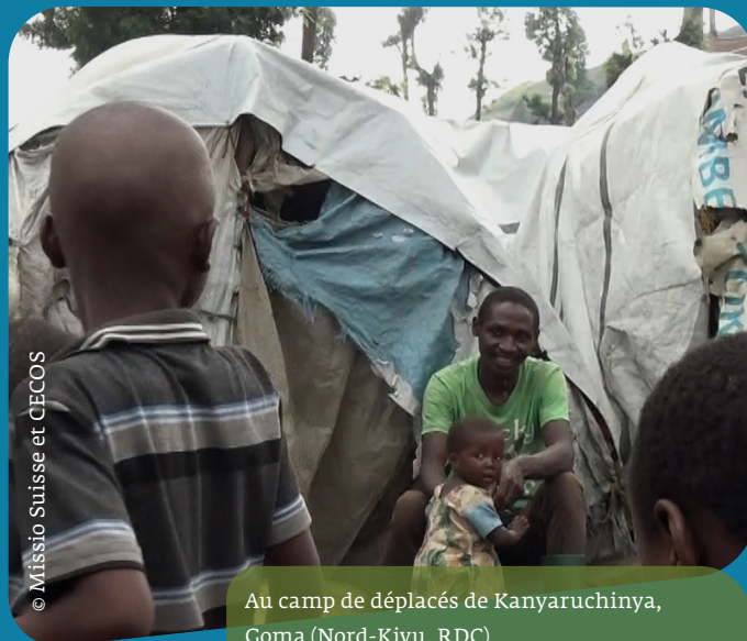
Au camp de déplacés de Kanyaruchinya, Goma (Nord-Kivu, RDC)