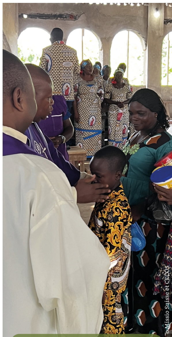
Messe dominicale, paroisse du St-Sacrement, Boma

Seigneur Dieu, trop d'enfants souffrent et il n'y a pas de bons Samaritains pour les soigner. Pourtant tout enfant aurait droit à la santé. Aide-nous à prendre soin de ceux que tu mets sur notre chemin, Seigneur, nous te le demandons par Jésus-Christ notre Seigneur. Amen.