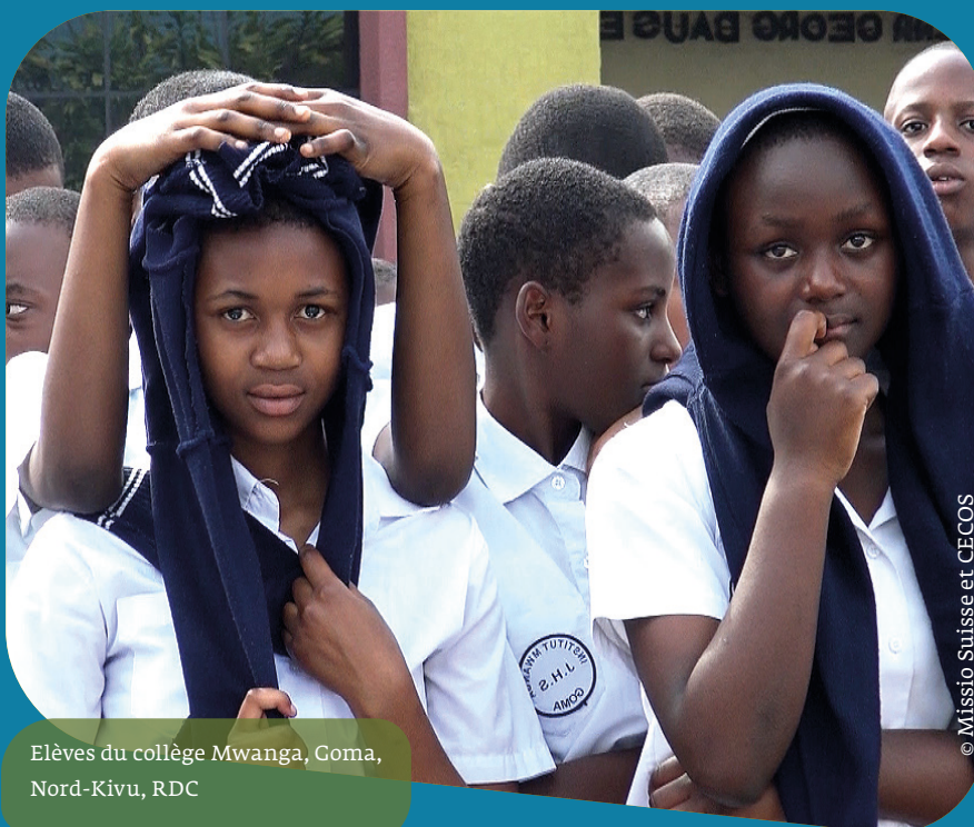
Elèves du collège Mwanga, Goma, Nord-Kivu, RDC